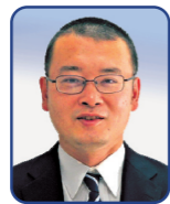
ゆうき さとし 結城 聡 九段