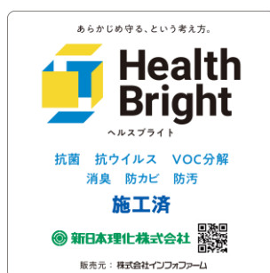
施工済ステッカー

抗菌・抗ウイルス効果をもつコーティング剤(商品名:Health Bright)を施設に噴霧し、施工後は施工済ステッカーを掲示いたしました。