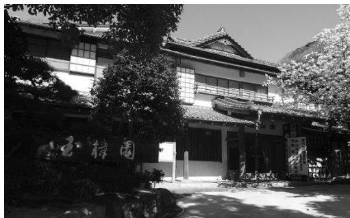
●過去に対局会場・宿舎となった施設の一例です